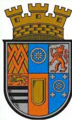
Wapenschild Stadt Muhlheim a/d Ruhr.

Behalve dat onze oudst bekende voorvader afkomstig is uit Muhlheim a/d Ruhr in Duitsland, weten we nog heel weinig van onze Duitse 'roots' of zo u wilt 'würfeln'.