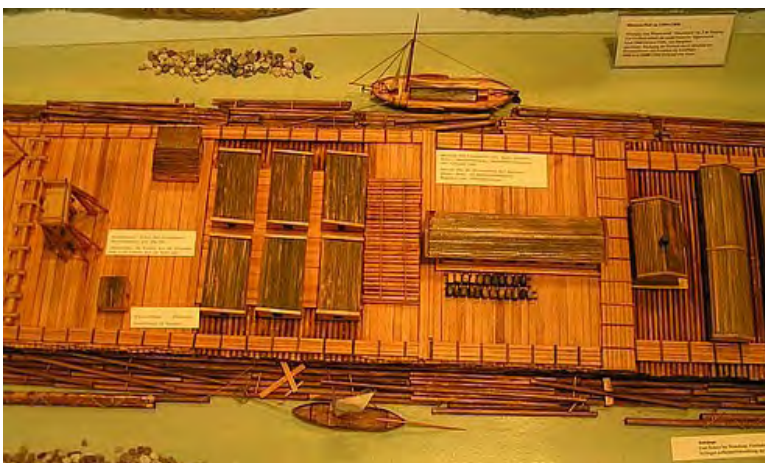
Helemaal links de 'stuurstoel' van de vlotmeester, dan het slachthuis, stallen en opslag. In het midden kantoor en woning van de vlotmeester en rechts de onderkomens voor de bemanning.

De eindbestemming voor de grote vloten was meestal Dordrecht of Rotterdam. Naar men zegt, werden onderweg soms delen van het vlot op tussen liggende bestemmingen achtergelaten. Een dergelijke reis duurde - als het niet tegen zat - een week of twaalf. De laatste honderd jaar van de vlotvaart werden de grote vloten echter zodra ze in Nederland kwamen ontbonden. Het hout ging vervolgens in kleinere eenheden verschillende kanten op.