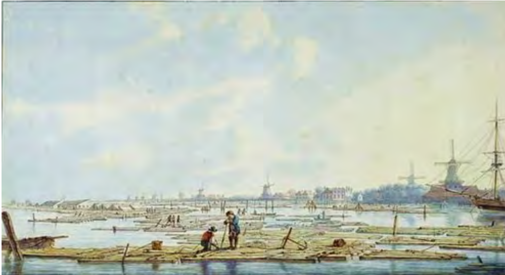
Een Rijnvlot na aankomst te Dordrecht. Linksachter ziet men de bebouwing op het vlot. Tekening A. van Strij, ca. 1800.

In het 'Vaarreglement' 1965 worden vloten nog wel genoemd, maar het aantal bepalingen is gering. Het Algemeen reglement van Politie voor rivieren en Rijkskanalen van 1919 (laatstelijk gewijzigd 1968) kent een veel groter aantal bepalingen. Daarin lezen we onder andere: