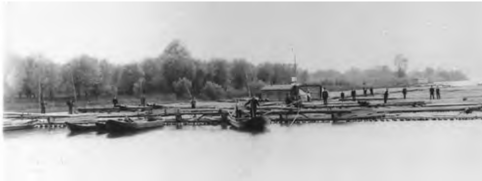
Een Rijnvlot begint te ontstaan. Foto uit de jaren 20 van de vorige eeuw.

Ook Mainz was een plaats waar vlotten werden samengesteld. De omvang van het vlot was in deze plaatsen gelimiteerd door de natuurlijke beperkingen van het Binger Loch. Boven Koblenz gold een breedtebeperking tot 63 meter, daar beneden werd het 72 meter en de laatste toevoegingen werden gedaan in Düsseldorf, alwaar de vlotten hun maximale afmeting kregen.