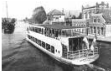
De rondvaartboot aan de kade.

Nadat iedereen binnen was, vertrokken wij, in colonne en door de regen, naar de rondvaartboot. Stipt om 13.00 uur staken we van wal en begon de rondvaart over het Braassemmermeer.