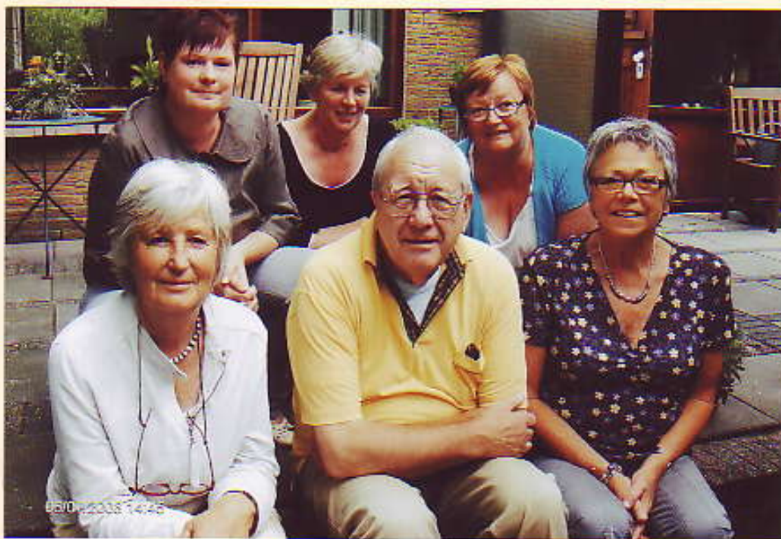
Het Stichtingsbestuur in vergadering bijeen.

Officieel orgaan van de werkgroep genealogie van de Familiestichting Scheepbouwer.