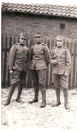
Mijn vader is de middelste.

Helaas heb ik geen foto van mijn vader als melkboer. Wel een foto van hem als militair in plm. 1924.