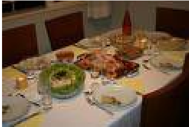
Er was een goed verzorgde tafel!

Na een goede maaltijd was het afscheid nemen geblazen en ging een ieder weer zijns weegs. Het bestuur van de Familiestichting Scheepbouwer heeft in ieder geval zijn best gedaan.