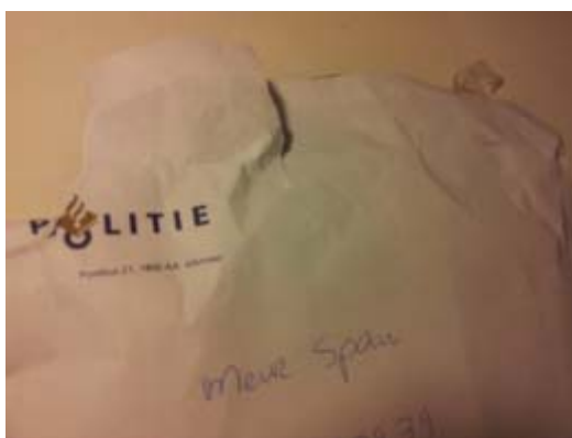
(Een deel van) het dossier?

Sinds vandaag heb ik alles weer compleet, min het contante geld en de kosten voor de bankpassen. Maar daar staat mooi wel een lucratieve spaarrekening tegenover, met een hogere rente van eh...nou ja, meer dan dat ik eerst kreeg. Die was ik anders toch maar mooi misgelopen. Blue monday . Prachtdag.