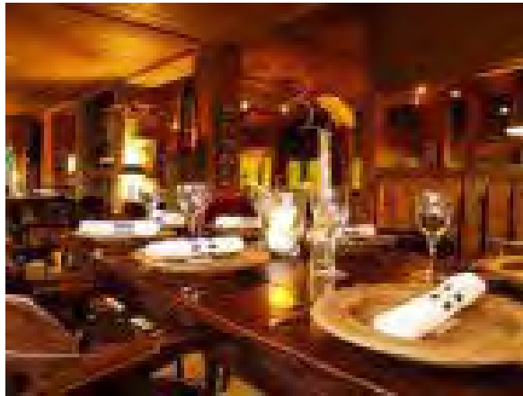
Grand Café RIANT

We werden vriendelijk ontvangen in het restaurant boven de paardenbak en vroegen of Arie ook aanwezig was. Even later kwam hij eraan, maar hij liep met een vierpoot en een beetje wankel. Tineke had hem in november gezien en toen vond ze hem er al niet goed uitzien. Dat bleek ook wel, want hij had toen al een bacterie in zijn bloed en was met de Kerst naar het ziekenhuis gebracht, want het zat ook in zijn ruggenmerg en hij moest geopereerd worden. Het leek toen wat beter te gaan, maar van burens van Arie, die daar ook zaten te eten hoorden we, dat hij met Pasen weer naar het ziekenhuis moest.