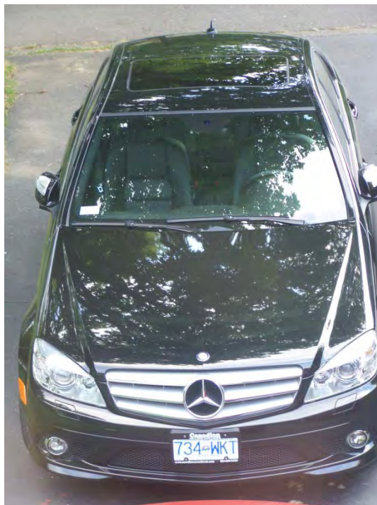
De Mercedes 300C