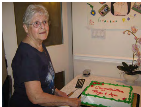
De jarige met haar taart.