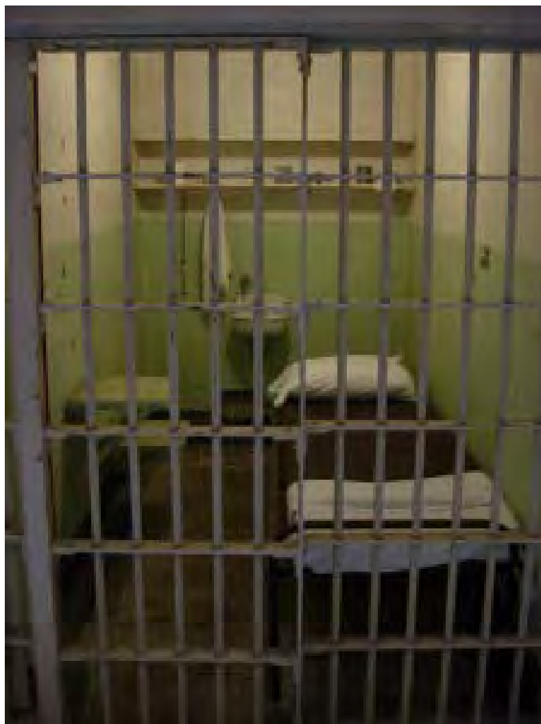
Cel van het Huis van Bewaring Vlissingen.

Nieuwsgierig geworden vroeg ik een afschrift aan van de desbetreffende registratie van het Huis van Bewaring.