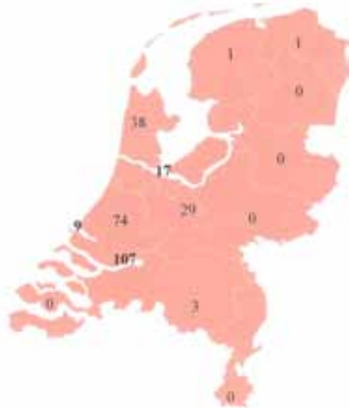
Aantal naamdragers per provincie plus Amsterdam, Rotterdam en Den Haag bij de volkstelling van 1947.