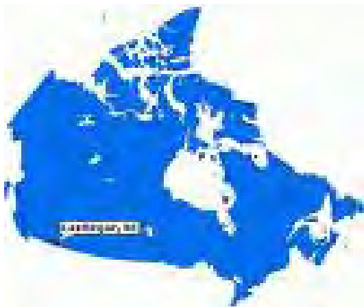
Kaart van Canada met de ligging van Castlegar.

Inmiddels hebben we iets meer informatie ontvangen: deze reünie zal plaatsvinden in het weekend van 31 juli - 2 augustus 2009 in Castlegar, (BC) , de woonplaats van Bill en Agi. Castlegar ligt op ongeveer 450 km. oostelijk van Vancouver.