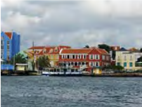
Curaçao: gezicht op Otrabanda.

Dat lukte niet direct in de eerste week, want waarschijnlijk had ik het van haar gekregen telefoonnummer toch nog thuis op tafel laten liggen en moest ik nog een keer naar Leida bellen om nogmaals - deemoedig - om dat nummer te vragen.