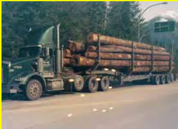
Dad's truck De Kenworth (475 pk), waarmee onze Canadese neef zijn brood verdient. (zie pagina 12 e.v.)

Officieel orgaan van de werkgroep genealogie van de familie Scheepbouwer